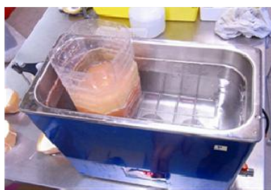
ダイレクションEXV-N3に浸漬洗浄