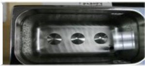
3ヶの特殊形状発振体