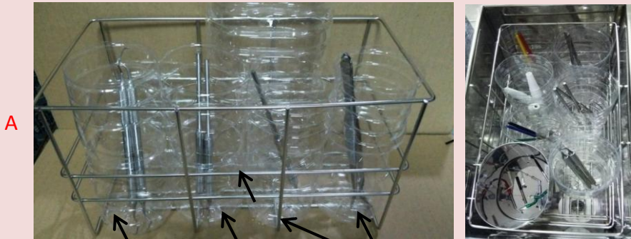
A カゴの中のそれぞれのペットボトルの横や底に多くの穴をあけてあります。

☑超音波洗浄時に密閉されました容器に入れた液が洗浄器内に流れないように十分注意して行ってください。