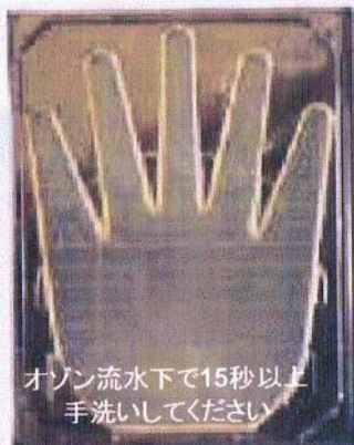
オゾン流水下で15秒以上 手洗いしてください